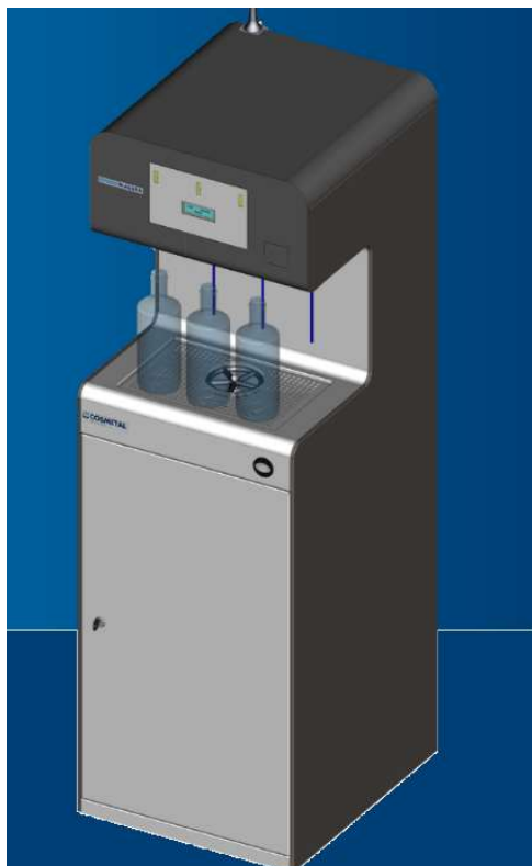
Dimensioni /Dimension (mm/inches)